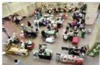
(令和7年7月「食材王国みやぎマルシェ」の様子)

5 その他 当県で実施する「令和7年度県庁1階食材王国みやぎ地産地消展示・即売会」の年間開催スケジュールについては別紙2を御参照ください。